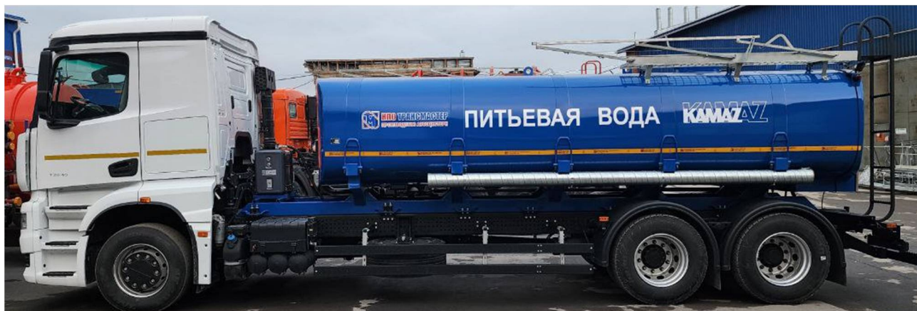
АЦПТ-13 КАМАЗ 65658-1764-49

предназначена для транспортировки и кратковременного хранения питьевой воды. Цистерна выполнена в виде горизонтального резервуара, с термоизоляционным слоем имеющего в поперечном сечении форму “чемодан”